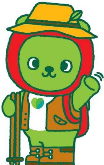
長野県PRキャラクター「アルクマ」 ©長野県アルクマ